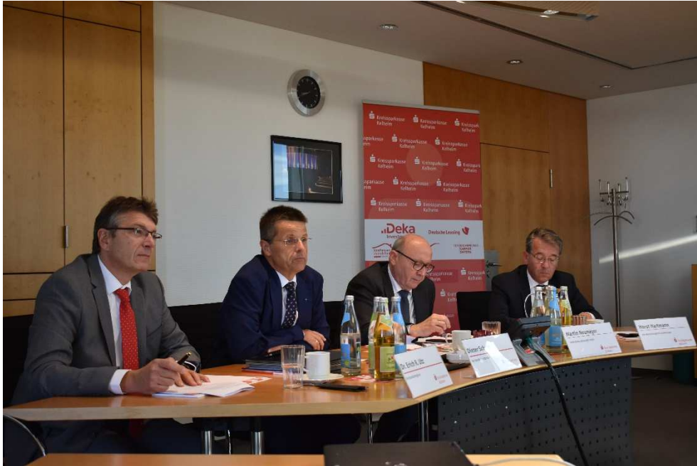
Pressegespräch „Veränderungen der Vertriebsstruktur“

Schwerpunktmäßig werden diese Berater, unabhängig von Öffnungszeiten, vor Ort bei den Kunden des Handwerks, der Landwirtschaft und des Mittelstands sein – auch am Abend. Die Umsetzung erfolgt im Januar 2019.